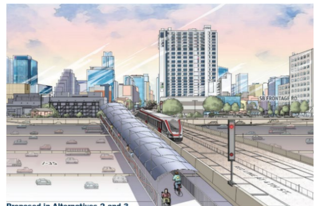
Proposed in Alternatives 2 and 3

Mejoras propuestas para I-35 en 4th Street