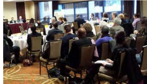
Downtown Stakeholder Working Group, 2013

TxDOT organiza la reunión de diseño de I-35 Capital Express Central para solicitar la opinión de las partes interesadas con respecto a los conceptos previamente desarrollados, incluyendo un plan para construir otra cubierta superior sobre las cubiertas superiores existentes. Se propusieron más de 30 conceptos en el transcurso de la reunión.